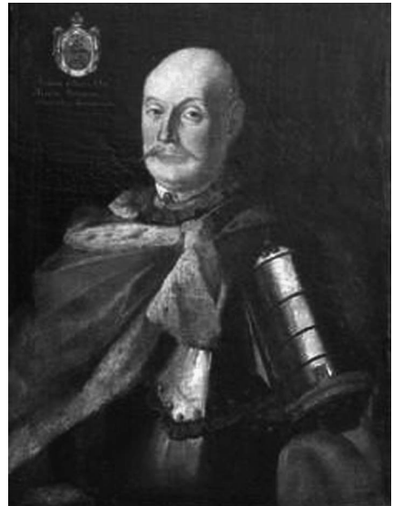
Портреты Эльзбеты Огинской и ее мужа Антония Пузины — видных деятелей польского просвещения.